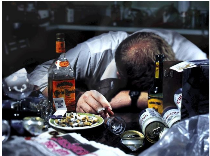
Figuur 1: een verslaafde

Verslaving is al heel lang bekend en wordt vaak gesplitst in twee verschillende soorten verslaving; geestelijke verslaving en lichamelijke verslaving. Geestelijke verslaving betekent dat je geestelijk aan de drugs gewend bent geraakt. Je denkt dat je die drugs nodig hebt om te overleven, terwijl dat helemaal niet zo is. Lichamelijke verslaving betekent dat je lichaam aan de stof gewend is geraakt. Zolang je de verslavende stof gebruikt, is er niets aan de hand, maar als je er mee stopt wordt het lichaam ziek, je krijgt afkickverschijnselen.