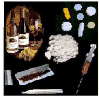
Figuur 2: allerlei soorten drugs

De laatste jaren zijn er steeds meer mensen, vooral in Amerika, die het niet meer eens zijn met deze theorie. Enkele Amerikaanse onderzoekers zijn er achter gekomen dat bij sommige verslavingen er veranderingen in de hersenen optreden. Door het nemen van een aantal stoffen worden er sommige receptoren in je hersenen extra gevoelig voor deze stoffen. Hierdoor wordt je extra gevoelig voor bepaalde stoffen. Volgens de Amerikaanse onderzoekers kun je alleen voor deze volgende vier stoffen verslaafd worden; Opiaten, amfetaminen, alcohol en nicotine. Nicotine en alcohol zijn waarschijnlijk wel bekend, nicotine zit in sigaretten en alcohol zit in veel verschillende dranken zoals bier, wijn en likeur. Amfetamine is een verzamelnaam voor verschillende soorten drugs, waaronder speed en cocaïne. Door amfetaminen krijg je een opgewekt gevoel, het lijkt alsof je meer energie hebt en alles kunt. Het bekendste opiaat is heroïne, door heroïne raak je erg versuft en hierdoor kunnen de verslaafden ontsnappen aan de sleur van het leven.